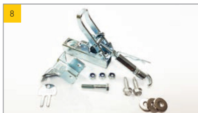
Artikel Kaiserverschluss inkl. Beipack Artikel-Nr. 0190112

Befestigung für Aufstellaggregate in der ESSMANN Lichtkuppel plus