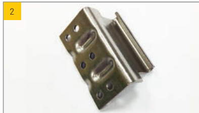
Artikel Scharnier-Oberteil Typ 810 Artikel-Nr. 0170271

Scharnier an der ESSMANN Lichtkuppel (RWA-Ausführung) Empfohlene Schraube 4,8x19 mm (s. Abbildung 23)