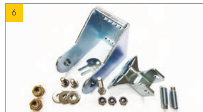
Artikel Konsole für Standard-Motor Artikel-Nr. 11000089540

Konsole mit Klemmsteinen für 230/24V Öffnern zur variablen Befestigung bei Schwenkbereichsbehinderung