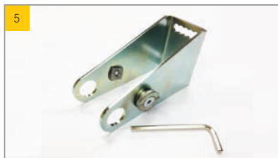
Artikel Lange Konsole für Motoren Artikel-Nr. 65504000

Scharnier am ESSMANN Aufsetzkranz (RWA-Ausführung) Empfohlene Schraube 4,8x19 mm (s. Abbildung 23)