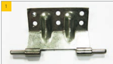
Artikel Scharnier-Oberteil RWG Artikel-Nr. 0170270

Scharnier an der ESSMANN Lichtkuppel (RWA-Ausführung) Empfohlene Schraube 4,8x19 mm (s. Abbildung 23)