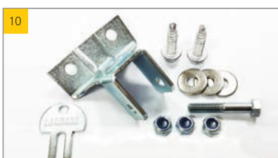
Artikel Beipack LK classic Artikel-Nr. 0391263

Manuelle Entriegelung für Aufstellaggregate in der ESSMANN Lichtkuppel classic