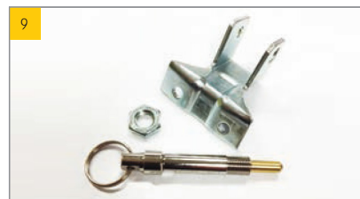
Artikel Schnappverschluss komb. DA/Beipack Artikel-Nr. 0390376

ESSMANN Lichtkuppel-Verschluss für innere Verriegelung