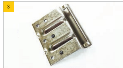
Artikel Scharnier-Unterteil Typ 810 Artikel-Nr. 0220504

Scharnier an der ESSMANN Lichtkuppel (lüftbare Ausführung) Empfohlene Schraube 4,8x19 mm (s. Abbildung 23)