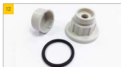
Artikel Abdeckkappe, Schraubkappe, O-Ring Artikel-Nr. 0151467, 0170171, 0166006

Manuelle Entriegelung für Aufstellaggregate in Verbindung mit Dachausstieg EDA-G