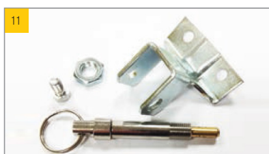
Artikel Umbau-Set EDA-G Lüftung Artikel-Nr. 0392708

Befestigung für Aufstellaggregate in der ESSMANN Lichtkuppel classic