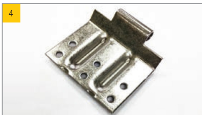
Artikel Scharnier-Unterteil RWG Artikel-Nr. 0220506

Scharnier am ESSMANN Aufsetzkranz (lüftbare Ausführung) Empfohlene Schraube 4,8x19 mm (s. Abbildung 23)